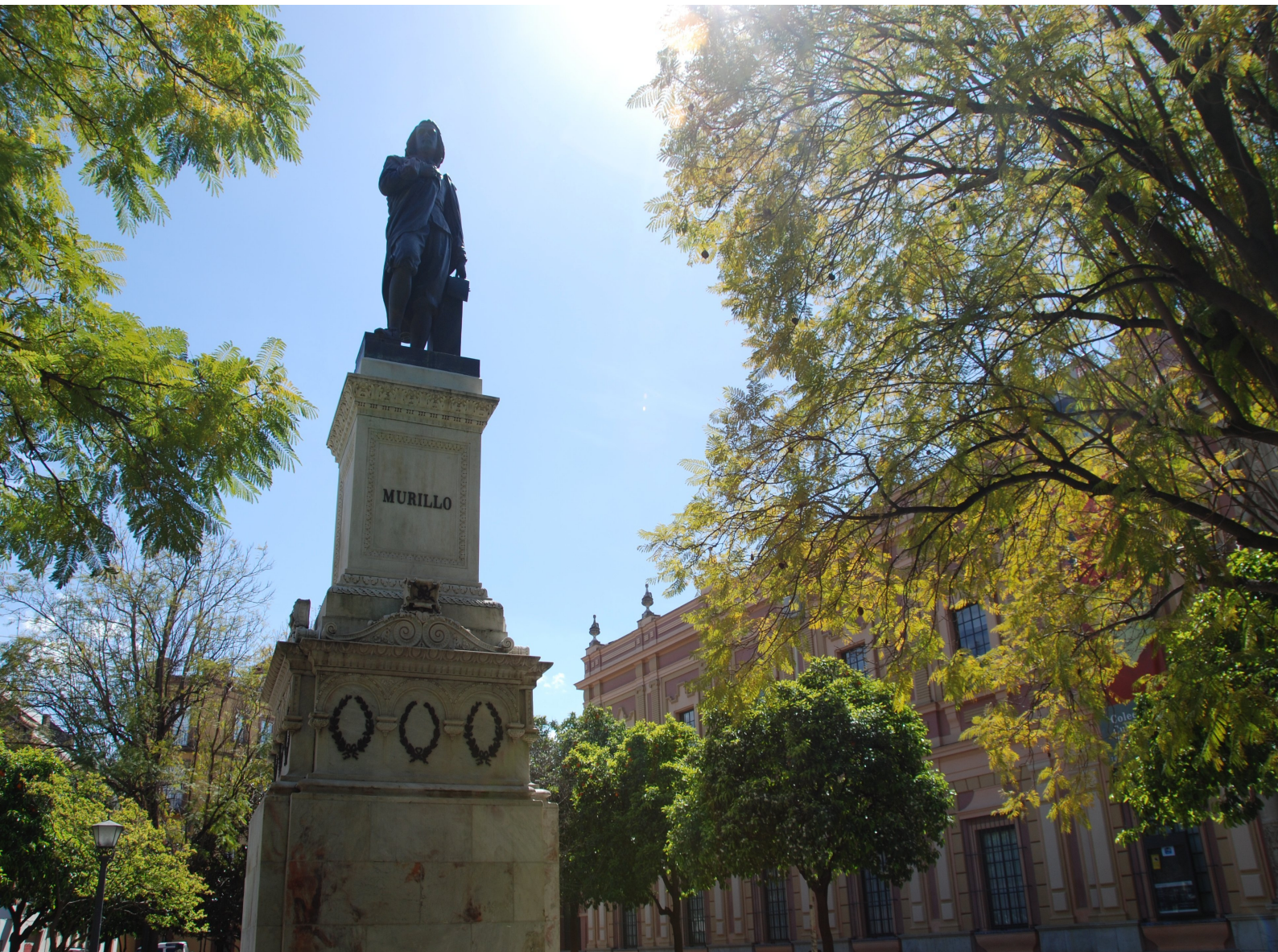
Plaza del Museo, con el monumento a Murillo

Venerables Sacerdotes, alberga también una selecta colección de pintura sevillana, que en fechas recientes ha sido aumentada con obras realizadas por Murillo.